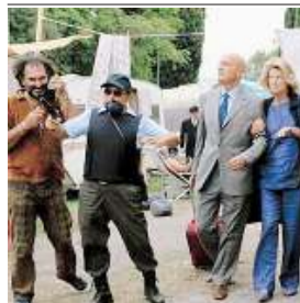
IL FILM Un'immagine di "Benvenuti al sud": ha superato i 20 milioni di euro di incassi